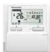
Vaste bediening met weektimer CZ-RTC4