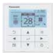
Vaste bediening met weektimer CZ-RTC5A